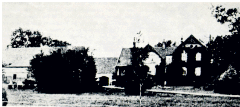
Kragelund efter ombygningen ca. 1890. Til højre den tilbyggede tværfløj. Fotografert omkr. 1910.